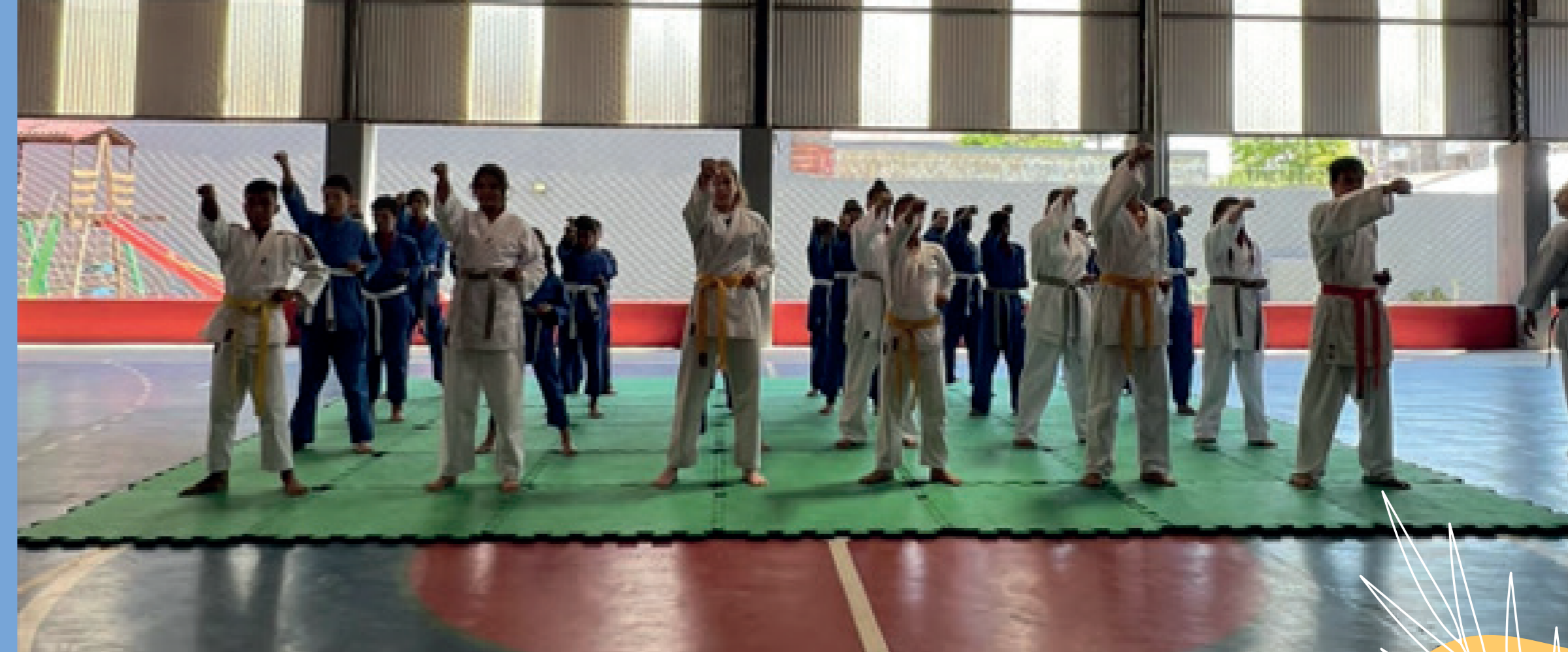
Apresentação do grupo de Karatê durante visita dos conselheiros do IJFC