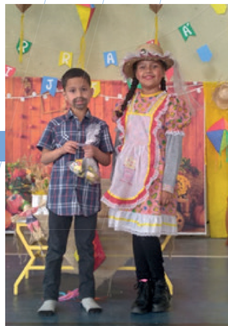
O Arraiá do IJFC