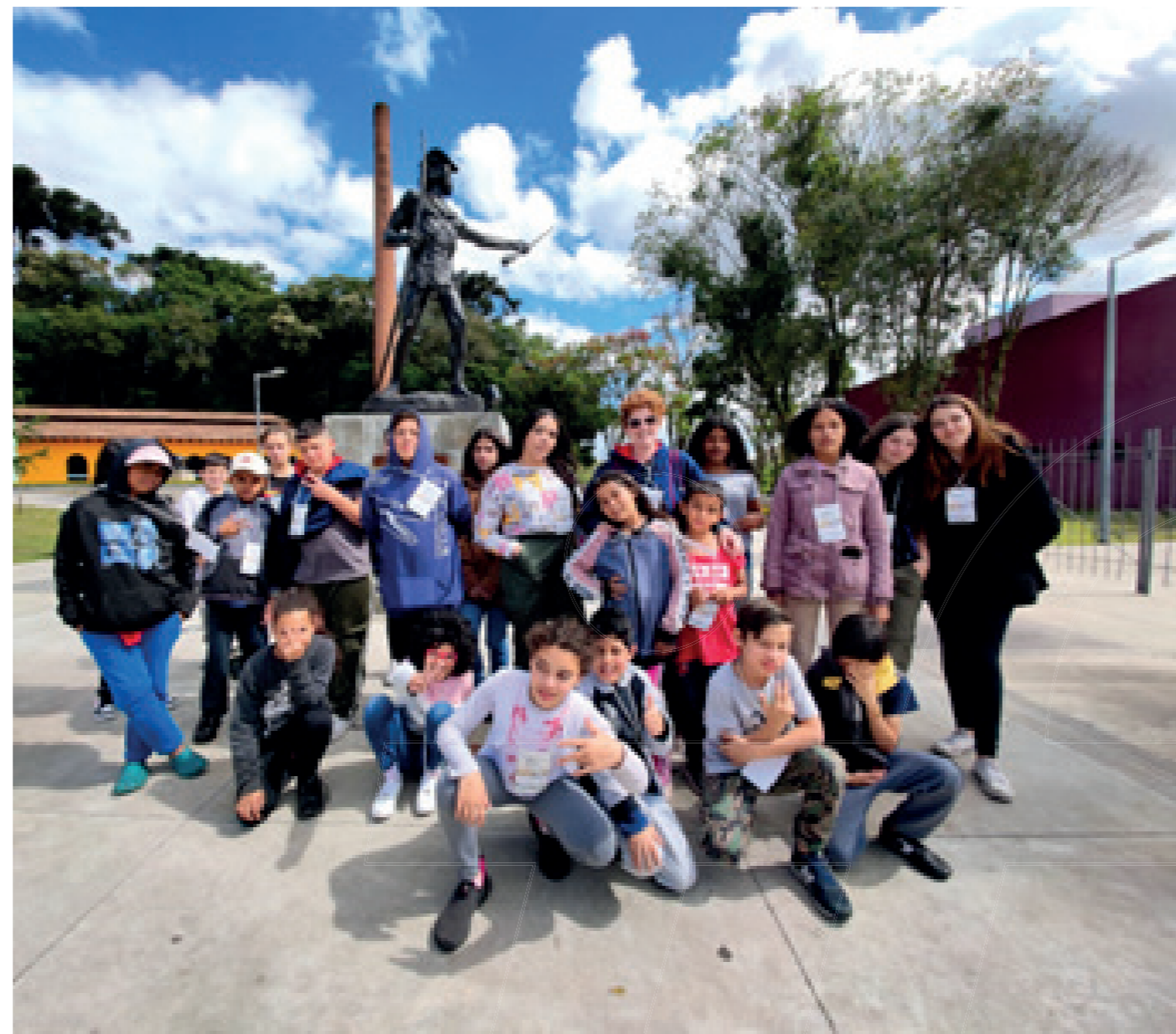
Passeio pelos pontos turísticos de Curitiba, em parceria com o SESC São José