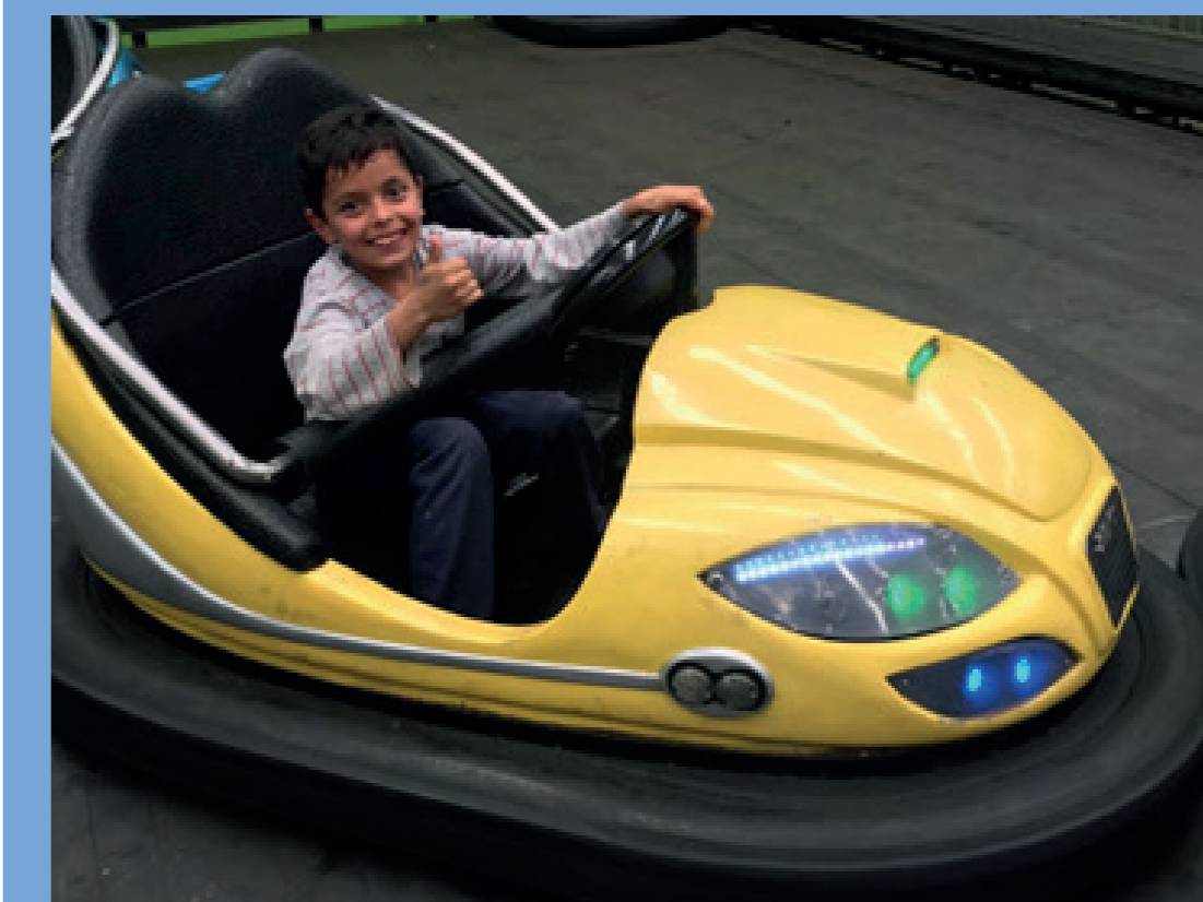
Nossas crianças tiveram uma tarde de muita diversão durante visita ao UNIPARK, em Curitiba