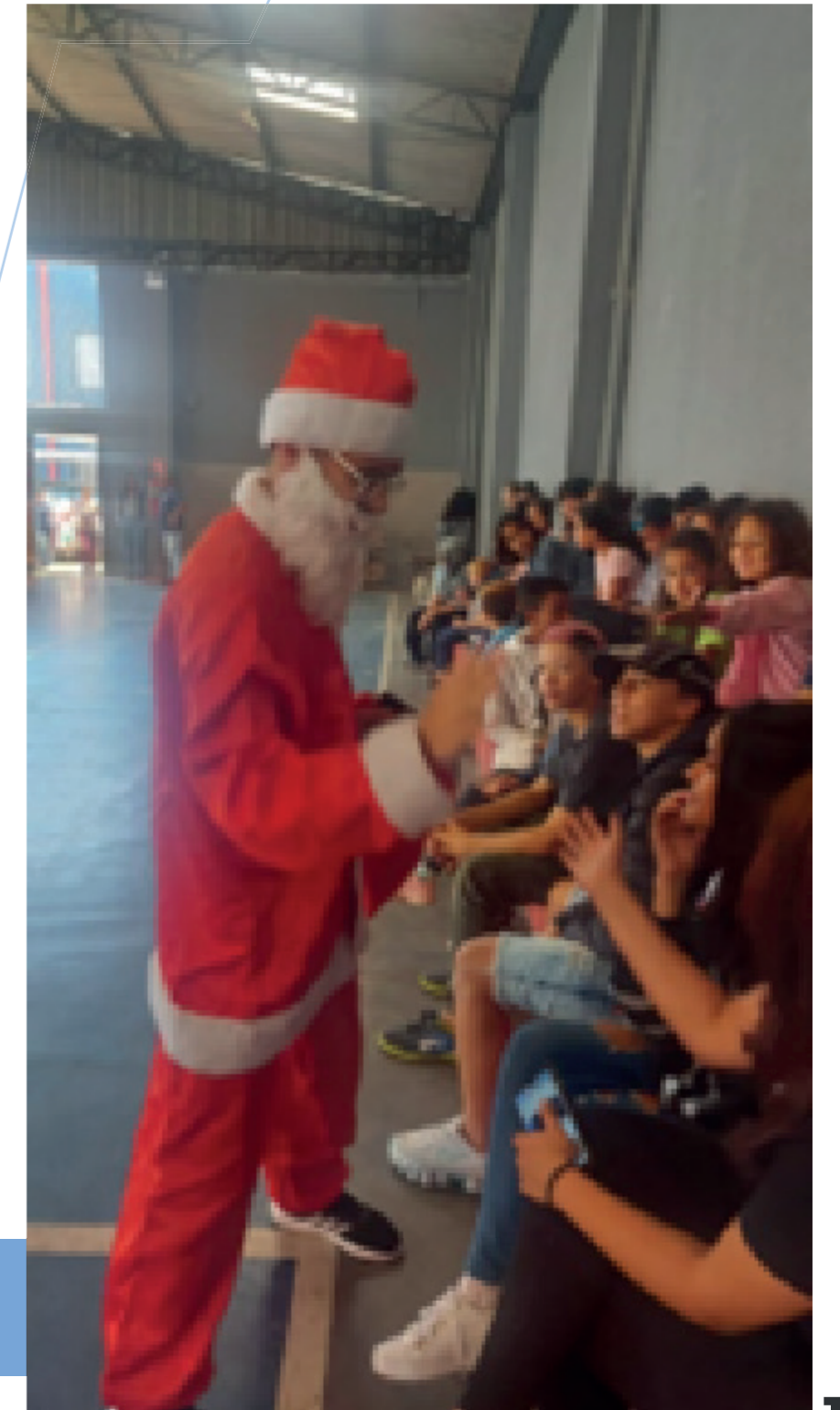
Comemoração de Natal em parceria com a Leme Inteligência Forense