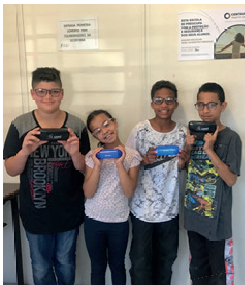
Grupo recebendo os óculos em parceria com a ação Pequenos Olhares