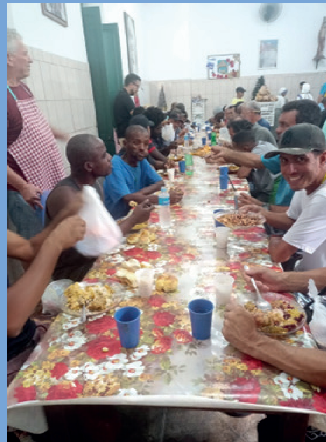
Almoço promovido pelas irmãs da Congregação