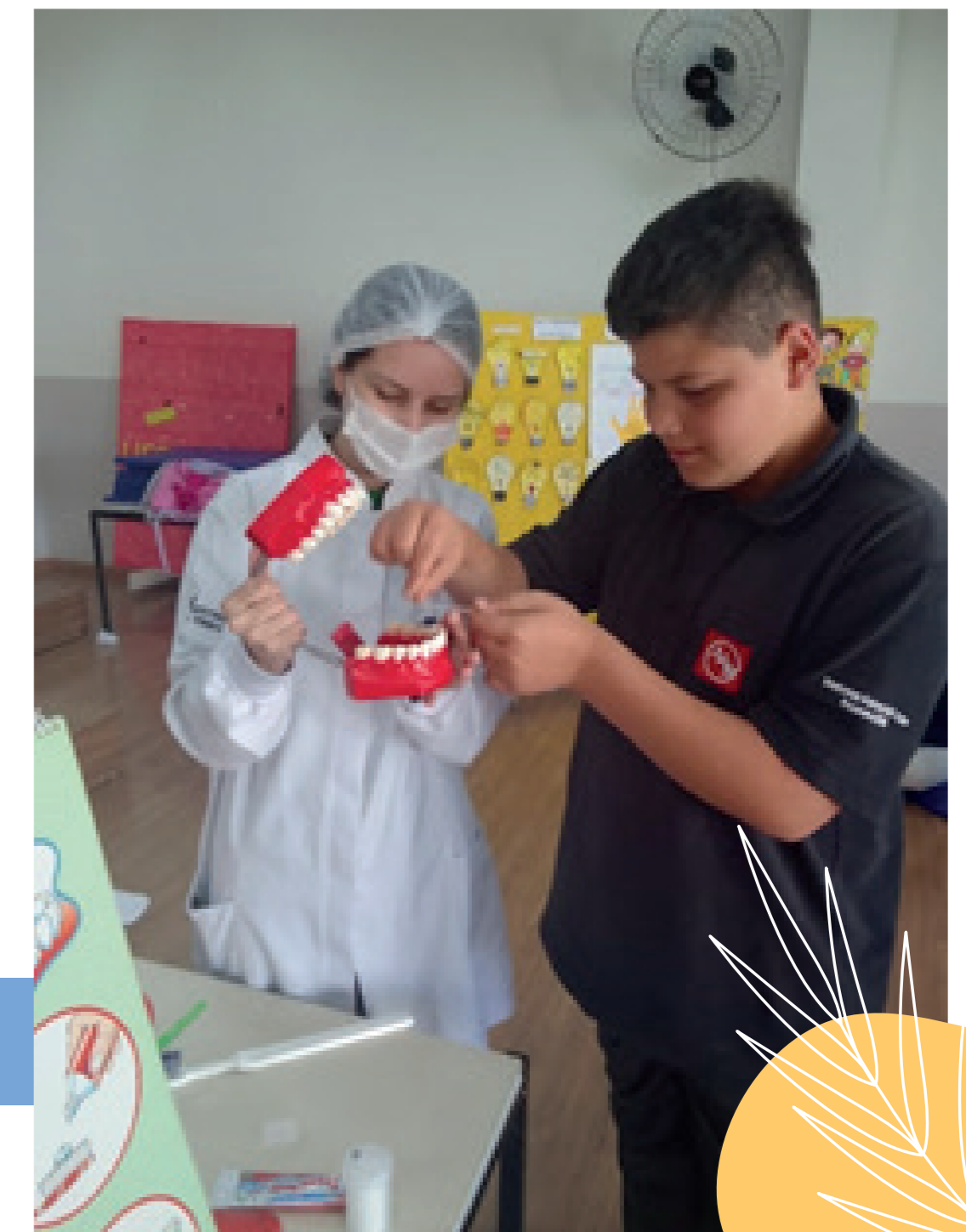
Aprendendo sobre higiene bucal em parceria com a equipe da Unidade Básica de Saúde do Vargem Grande