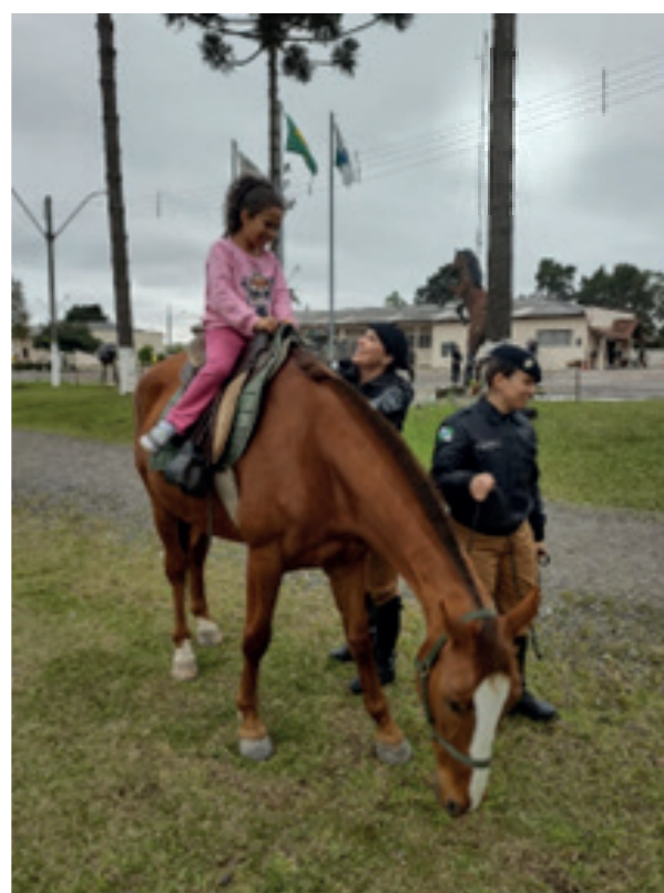
Visita ao quartel da Polícia Militar no mês da criança.