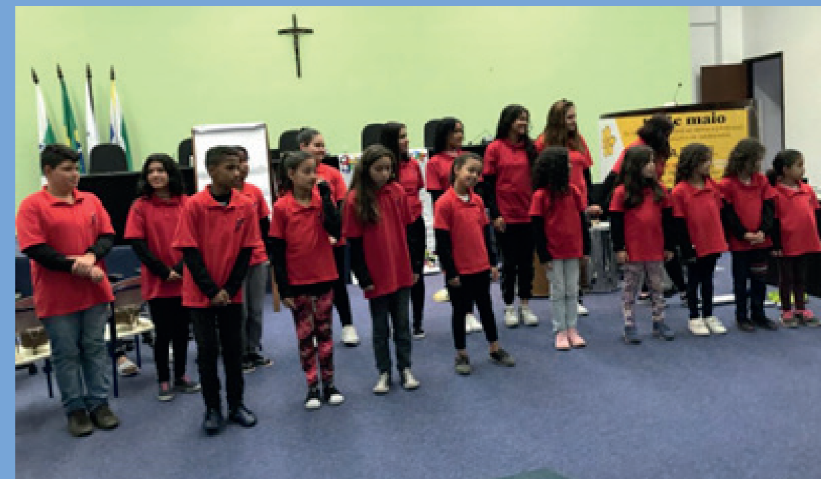
Apresentação do coral performático na Câmara Municipal de Pinhais, que contou com a presença de inúmeras autoridades políticas e jurídicas.