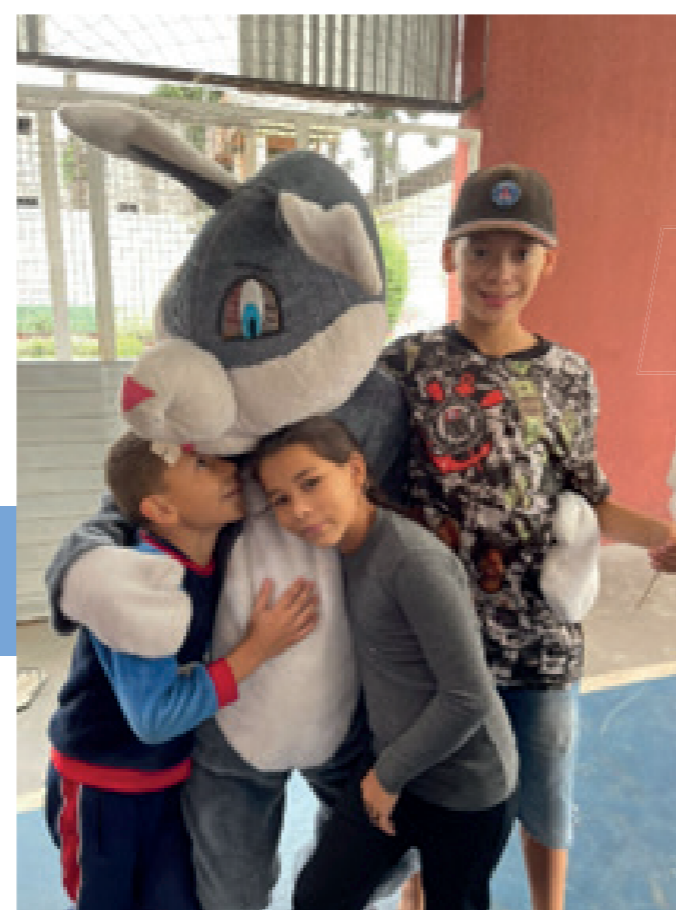
Crianças se divertem com o coelho da Páscoa.