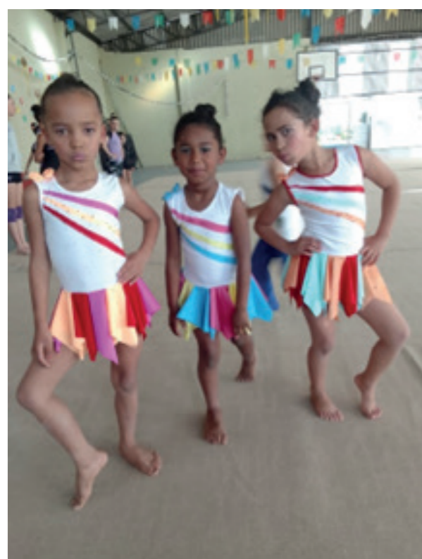
Equipe de Ginástica Rítmica se apresenta em parceria com a Escola Fantástica de Ginástica Rítmica.