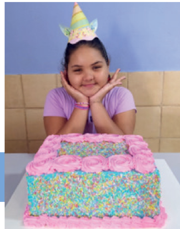
Durante o ano, comemoramos os aniversariantes de cada mês com um delicioso bolo