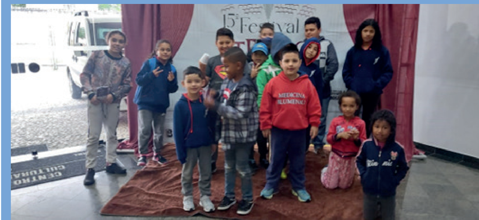
Visita ao Teatro na Secretaria de Cultura de Pinhais.