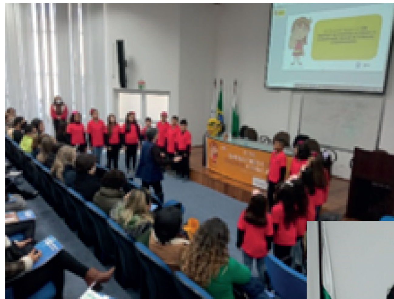
Reunião Municipal em comemoração do 18 de maio, que contou com a presença das principais autoridades políticas do município e a Rede de proteção. O evento contou com a apresentação do coral performático do IJFC