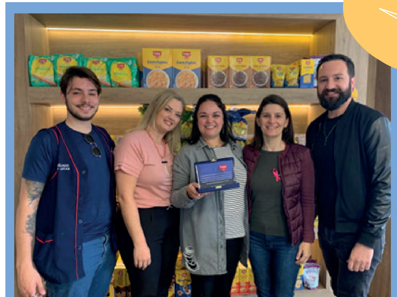
Entrega de condecoração de agradecimento à equipe da Dr. Schar pelo apoio e doação larga de alimentos durante o ano de 2022