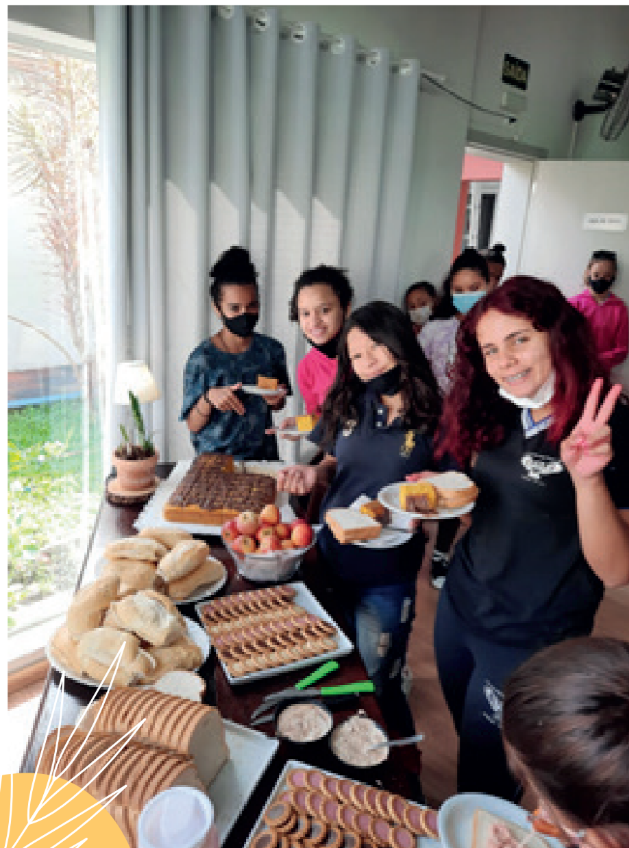
Adolescentes aproveitando o café durante o encontro do mês da mulher.

Em março, comemorou-se o mês da mulher com um café especial para nossas meninas, com rodas de conversa que exaltavam a feminilidade e a importância da luta de todos contra a violência contra a mulher.