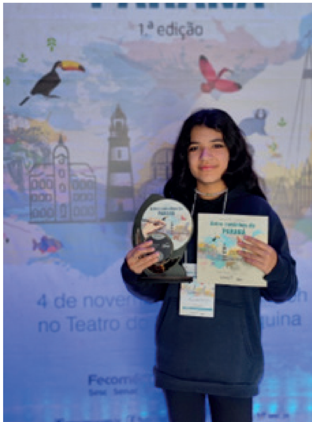
Adolescente premiada pelo seu desenho representando o museu Oscar Niemayer no Concurso Entre Caminhos do Paraná – 1ª edição, promovido pelo SESC-PR