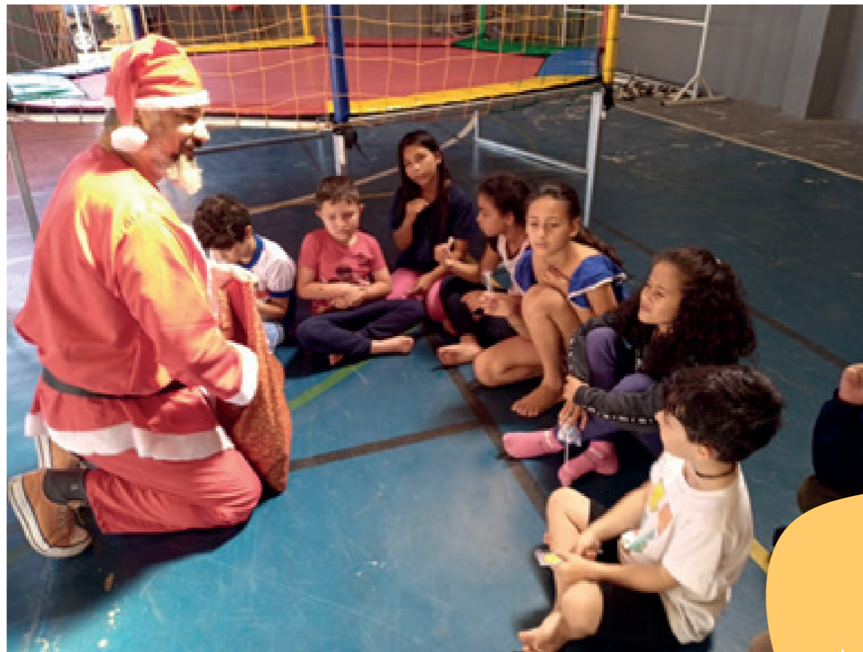
Comemoração do Natal em parceria com o SESC São José