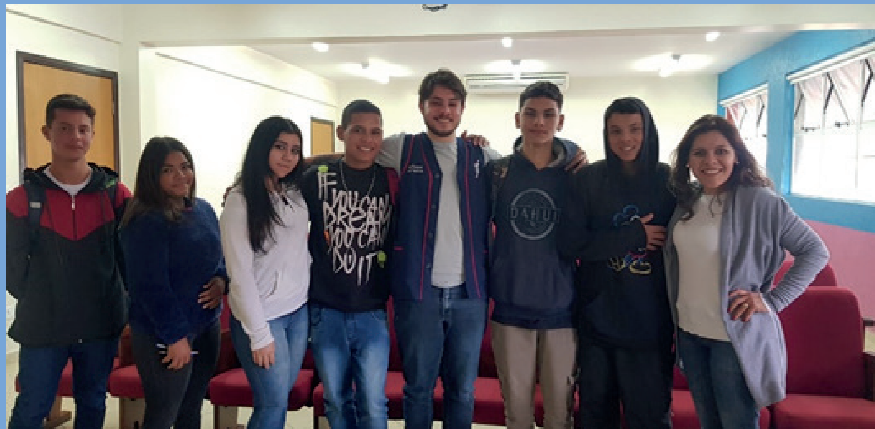
Adolescentes iniciam o curso de Pré-Aprendizagem na fundação Weiss Scarpa.